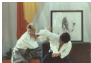
Kisshomaru Ueshiba 1921-1999 Fils du fondateur Doshu de 1969 à 1999