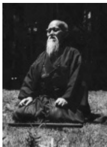
Morihei Ueshiba 1883-1969 Fondateur de l'Aïkido