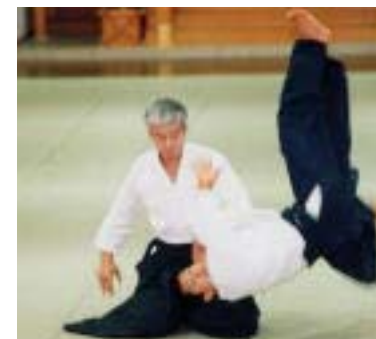
Moriteru Ueshiba 1951 Petit-fils du fondateur Actuel Doshu depuis 1999